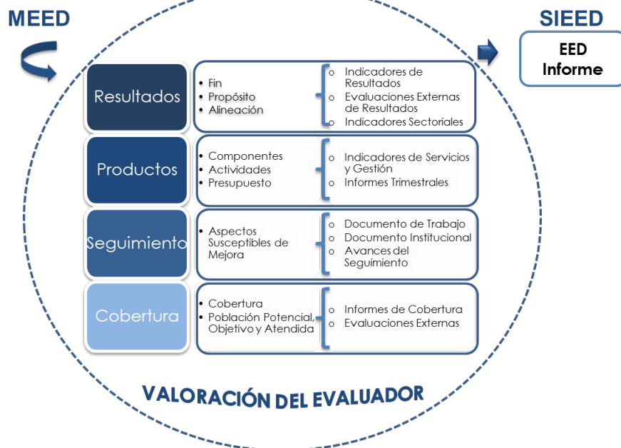
Esquema 1. Contenido general de la Evaluación Específica de Desempeño