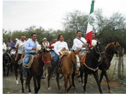
Cabalgata de Ejido Estación San Francisco al Ejido Nuevo San Francisco.