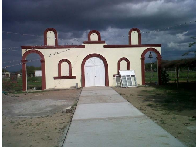
Centro de bienestar Ejido 19 de Abril