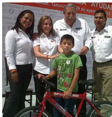
Entrega de bicicletas a alumnos.

En el mes de noviembre el DIF municipal llevó a cabo una dinámica denominada “Ponte mis zapatos” con alumnos de preescolar, primaria, secundaria y medio superior con la finalidad de concientizar a las personas de la importancia de ayudar o apoyar a personas con capacidades diferentes.