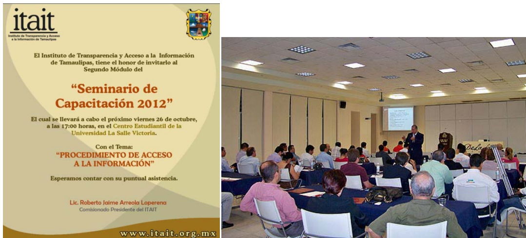
Capacitación en transparencia y acceso a la información.

Nos queda claro que hoy más que nunca la sociedad demanda la rendición de cuentas y la administración pública requiere de transparentar la aplicación de los recursos para su fortalecimiento; en este contexto y en cumplimiento de la ley de transparencia, la información pública se encuentra a disposición de los ciudadanos en la secretaria del ayuntamiento, además de estar publicada en la página WEB de la Contraloría del Estado.