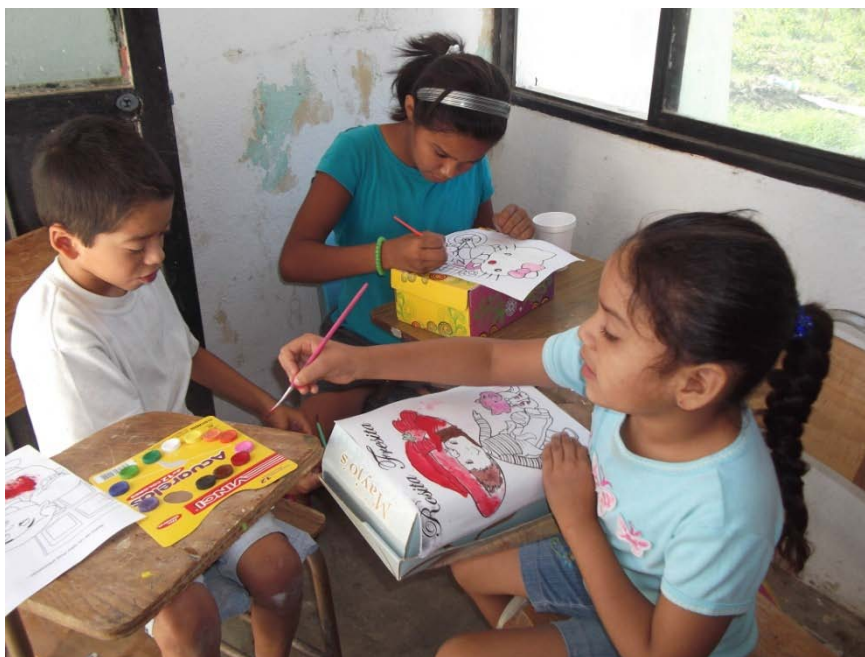
Alumnos del Curso de Verano.

En el mes de julio, se llevó a cabo el Segundo Campamento de Verano , en las instalaciones de este Centro de Desarrollo Integral para la Familia, CEDIF y en el Ejido El Amparo , con una asistencia de 47 niños de 6 a 13 años de edad, quienes estuvieron participando en los Cursos Taller de Manualidades y Cocina , así como en diferentes actividades físicas y recreativas, como futbol, voleibol, pláticas de valores, juegos y dinámicas grupales , además de meriendas para los asistentes .