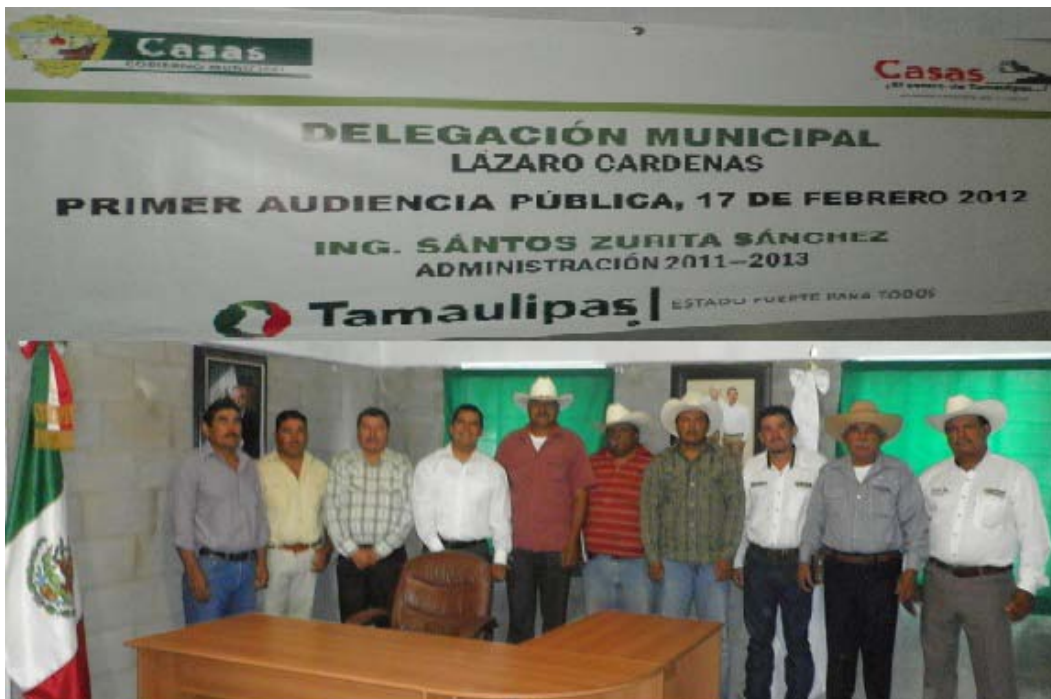
Audiencias en la Delegación Lázaro Cárdenas

En la Delegación 02 Lázaro Cárdenas, iniciamos operaciones a partir del 17 de febrero, otorgando audiencias a los ciudadanos y además se entregaron uniformes a los voluntarios de protección civil que colaboran en esta delegación proporcionando servicio a las contingencias que se presentan en las comunidades, así como en accidentes del tramo carretero victoria Zaragoza.