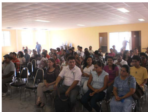
Ceremonia de entrega de becas a alumnos del nivel medio superior.