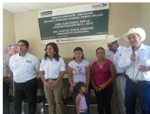
Inauguración del Desayunador de la Escuela Gabriel Ramos Millán del Ejido El Amparo.