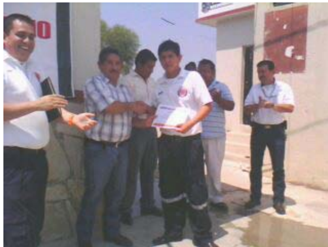
Entrega de constancias a los voluntarios de Protección Civil

La participación de la sociedad, en las acciones de protección civil es muy útil, pues colaboran con la administración pública y se constituyen en coadyuvantes de acciones que benefician a la propia sociedad.