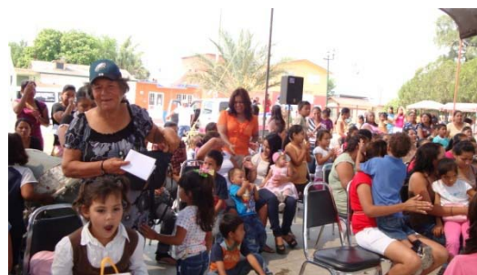
Festejo del día del niño.