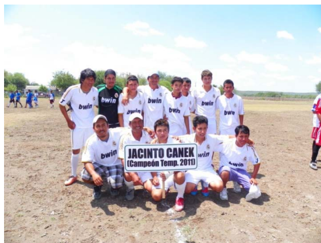
Torneo de Futbol rápido Dr. Egidio Torre López.

En fomento a las actividades deportivas en todas nuestras comunidades, organizamos un torneo relámpago de futbol soccer denominado Dr. Egidio Torre López , en las instalaciones deportivas del Ejido El Amparo .