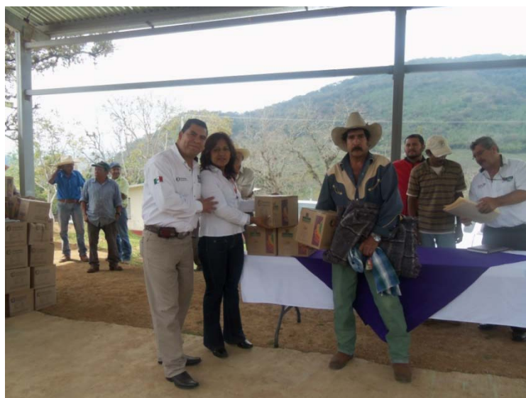
Entrega de despensas y apoyo invernal en el Ejido Eduardo Benavides.

También se otorgo este apoyo en las localidades de Praxedis Balboa, Congregación González, San Vicente, Buenavista y las rancherías La Pasadita, Las Tranquitas, Santa María de la Noria y Santa Lucia.