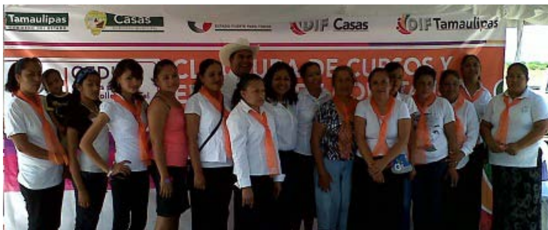
Grupo de CEDIF Lázaro Cárdenas.

Con la finalidad de mejorar la calidad de vida de las familias y fomentar el autoempleo, en el transcurso del año, a través de los Centros para el Desarrollo Integral de la Familia, CEDIF y proporcionándoles lo necesario se impartieron gratuitamente cursos de Manualidades, Cocina y Corte y Confección a mujeres de los Ejidos El Amparo, Lázaro Cárdenas, Felipe Ángeles y Nuevo San Francisco.