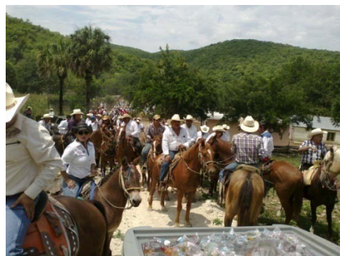
Cabalgata de El Moro a San Antonio el Grande, 242 aniversario de Casas.