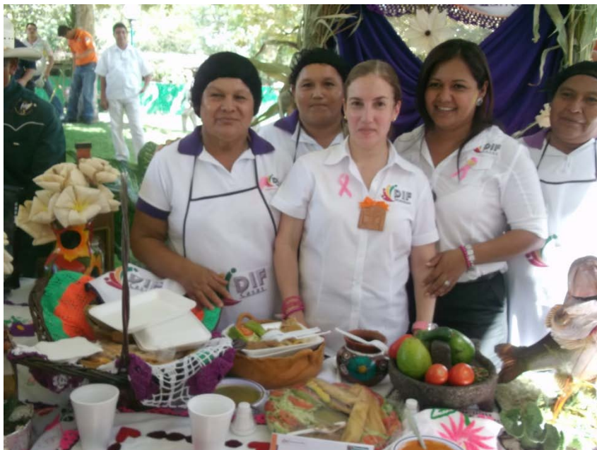
Concurso de elaboración de platillos.

También participamos en el Segundo Concurso de Elaboración de Platillos Regionales , con un platillo típico elaborado a base de carne de venado de la región.