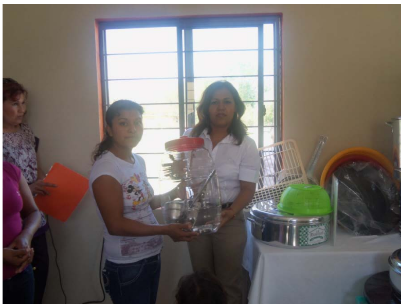
Equipamiento del desayunador de la Escuela Gabriel Ramos Millán del Ejido El Amparo.