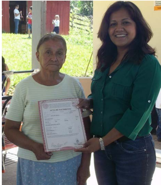
Entrega de actas de nacimiento en campaña de registro civil.

Fuera de estas campañas y de manera gratuita se entregaron 37 actas de nacimiento, en diferentes comunidades del municipio a personas de bajos recursos.