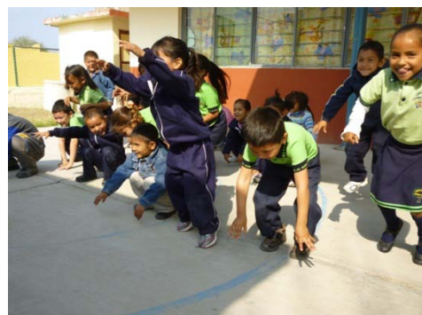
Fomento de la cultura en los niños del municipio.