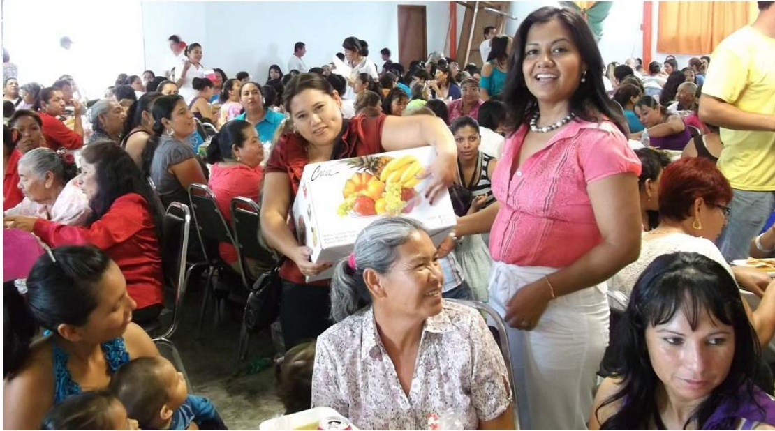
Festejo del día de las madres.

Realizamos festejos con motivo del Día de las Madres , en las comunidades de las delegaciones, San Antonio, Nuevo San Francisco, y la Cabecera Municipal , en los que atendimos a 498 mujeres con un convivio, alimentos y sorteos, además de un regalo a cada una de ellas.