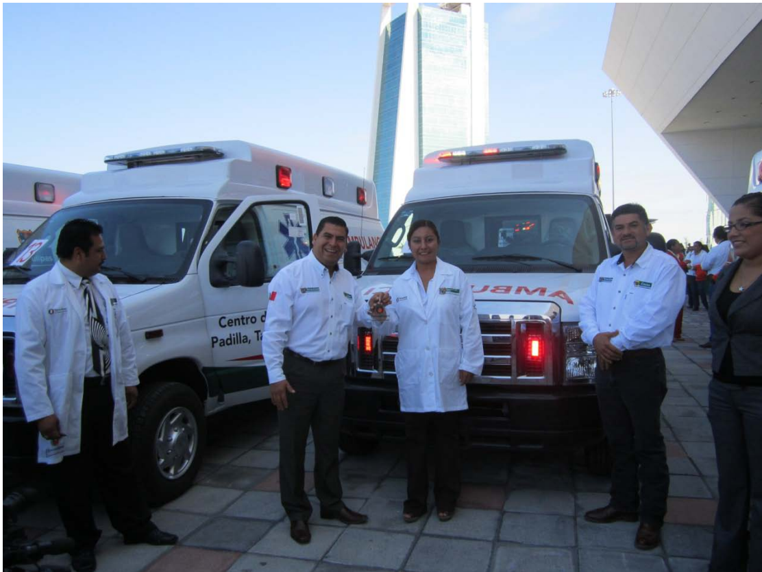
Recibiendo ambulancia para la Delegación 03 Nuevo San Francisco.