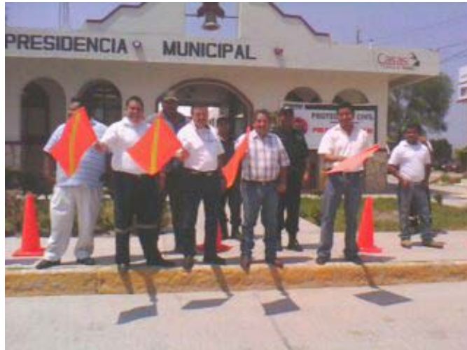
Instalación del modulo de Protección Civil.

Además de la instalación de el puesto de socorro en la Presidencia Municipal durante el periodo vacacional, para brindar atención en los incidentes que se presentaron en los tramos carreteros hacia Villa de Casas .