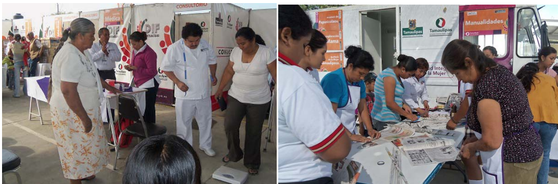
Jornada Multidisciplinaria en el Ejido Lázaro Cárdenas.

Durante estas Jornadas Multidisciplinarias se contó con el apoyo del Registro Civil , ITAVU , Secretaría de Desarrollo Rural y el Instituto de la Mujer , dando atención a 300 personas.