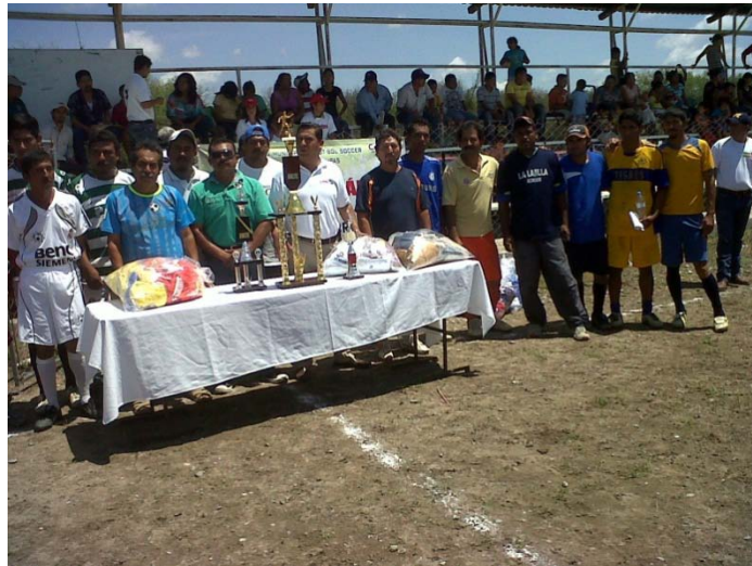
Entrega de Trofeos a participantes del torneo de futbol rápido Dr. Egidio Torre López.

En este mismo evento se entregaron también accesorios para la práctica del beisbol al equipo del Ejido Buenavista .