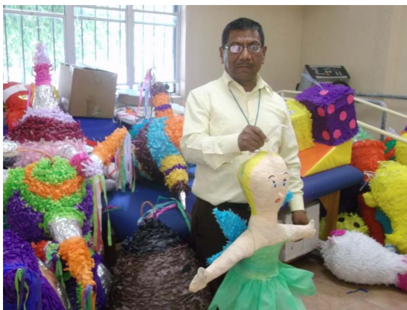
Taller de elaboración de piñatas.

Se formó el Taller de Elaboración de Piñatas , en beneficio de personas con capacidades diferentes, proporcionándoles el material necesario para la elaboración de piñatas a cada persona y se les remuneró su esfuerzo con un estímulo económico. Las piñatas se utilizaron para las celebraciones del Día del Niño en el Municipio.