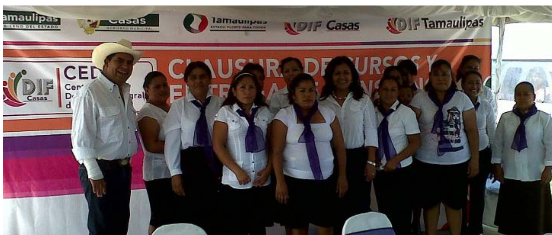
Grupo de CEDIF Ejido El Amparo.