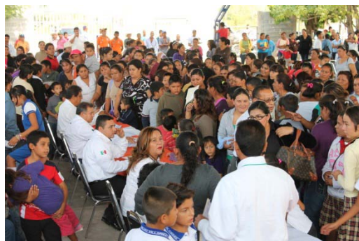
Ceremonia de entrega de becas en coordinación con Gobierno del Estado.