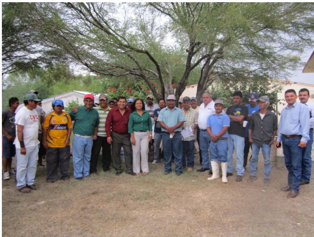
Entrega de apoyo para la adquisición de redes a los pescadores del Ejido Jacinto Canek.

En la cadena productiva de pesca, se entregaron redes a 35 pescadores del ejido Jacinto Canek con una inversión de 30 mil 500 pesos, para la captura de tilapia, en este mes se entregarán 14 motores fuera de borda a la sociedad cooperativa isla Guayabas del ejido Jacinto Canek, con una aportación por parte de gobierno del estado de 1 millón 120 mil pesos.