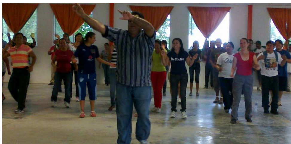
Personal del Ayuntamiento y DIF municipal.

Como parte de las actividades del Sistema DIF municipal, se impartieron clases de zumba, en la Cabecera Municipal , y en los Ejidos La Lajilla, Jacinto Canék y Lázaro Cárdenas .