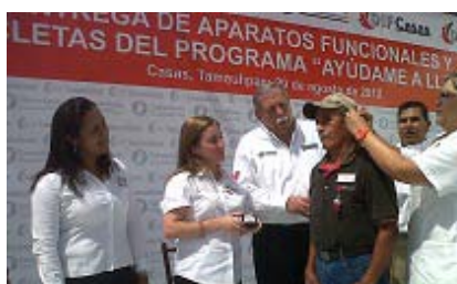
Entrega de aparatos auditivos.

En la visita del Gobernador del Estado Ingeniero Egidio Torre Cantú y de la señora María Del Pilar González de Torre a nuestro Municipio, se entregaron aparatos auditivos a 9 personas, 4 sillas de ruedas y 71 bicicletas del programa Ayúdame a Llegar : a alumnos que recorren más de tres kilómetros para llegar a su centro educativo, así mismo recibimos una silla de ruedas y una cama de hospital para el Sistema DIF municipal para dar servicio a la población que lo requiera.