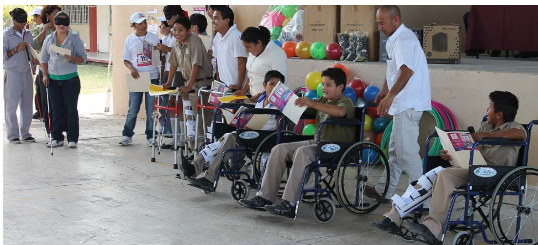
Dinámica “Ponte mis zapatos” con alumnos de preescolar, primaria, secundaria y nivel medio superior.

En el mes de noviembre el DIF municipal llevó a cabo una dinámica denominada “Ponte mis zapatos” con alumnos de preescolar, primaria, secundaria y medio superior con la finalidad de concientizar a las personas de la importancia de ayudar o apoyar a personas con capacidades diferentes.