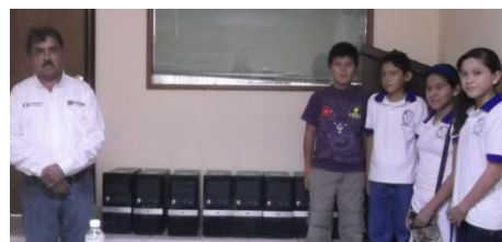
Entrega de equipos de cómputo a alumnos de la secundaria Romualdo Villarreal González.