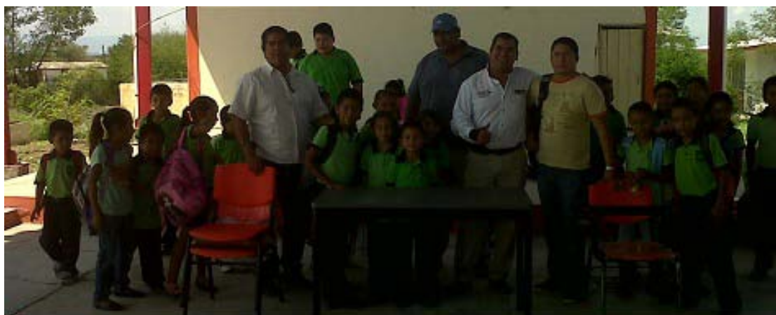
Entrega de mobiliario a la Escuela Amado Nervo del Ejido La Lajilla.

Gracias al apoyo incondicional que nuestro municipio tiene por parte del Ingeniero Egidio Torre Cantú, Gobernador Constitucional del estado, en este ciclo escolar todas las escuelas del municipio fueron dotadas con mobiliario nuevo consistente en bancos, escritorios, sillas y pintarrones con el firme propósito de que los alumnos reciban una mejor educación.