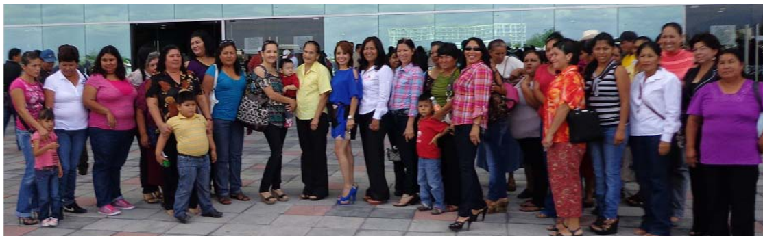
Participación en los festejos del Día de la Mujer.

Para celebrar el Día Internacional de la Mujer llevamos a cabo actividades en la Cabecera Municipal, con la asistencia de 350 mujeres de todas las edades, las cuales participaron en una rifa de regalos, dinámicas, conferencias y un convivio.