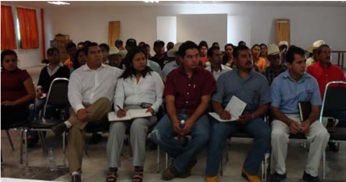
Personal del ayuntamiento y del DIF municipal en taller de capacitación.

La permanente capacitación de los servidores públicos municipales, permite que se desempeñen en un marco de eficiencia, pero sobre todo de transparencia; esta administración tiene muy claro que el servidor público está obligado a trabajar en beneficio de la ciudadanía, pero sobretodo, tener muy claro que los recursos federales, estatales y municipales son asignados para garantizar la cohesión social, por ello se requiere que se apliquen de acuerdo a las reglas de operación que establecen las instancias normativas.