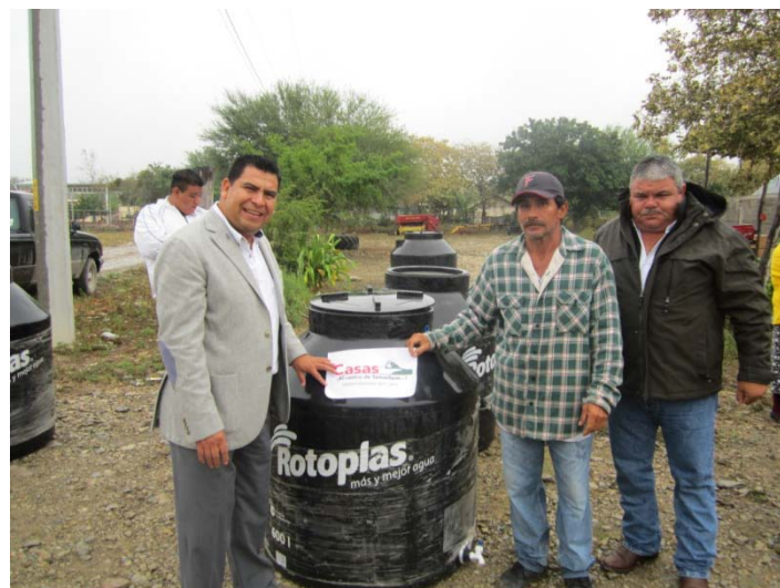
Entrega de tinacos en el Ejido Buena Vista.

Ante la carencia de depósitos del vital líquido en las comunidades, la demanda de depósitos de agua fue creciendo, por lo que gestionamos las unidades suficientes para cubrir la demanda de las familias más necesitadas, obteniendo la autorización de 271 depósitos de agua con una inversión de tres millones setenta y ocho mil 600 pesos.