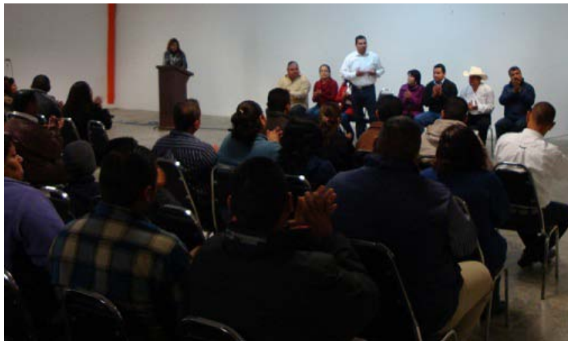
Plática y capacitación a comisariados y delegados municipales.

En marzo de este año la secretaría del ayuntamiento desarrollo un curso taller para las autoridades ejidales, dirigido a comisariados ejidales y delegados municipales con la finalidad de mantener una relación y coordinación con las comunidades en relación al bando de policía y buen gobierno, que los faculta como autoridades municipales para coadyuvar en el fortalecimiento municipal.