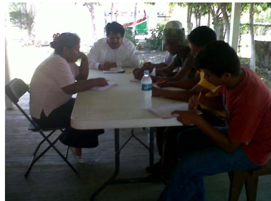
Voluntarios tomando capacitación para prestar sus servicios en Protección Civil, Delegación Lázaro Cárdenas.