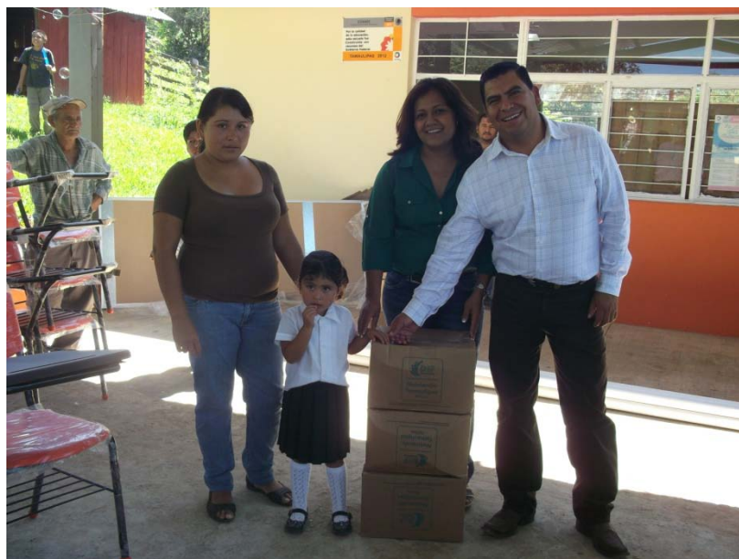
Entrega de despensa a niños que no cuentan con desayunador en su escuela.

Con el Programa Desayuno en Casa , se beneficia con una despensa mensual a 209 niños de instituciones que carecen de un desayunador escolar.