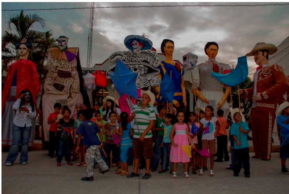
Actividad artística en el Festival Internacional Tamaulipas.

Del 27 de septiembre al 7 de octubre, artistas estatales y nacionales se dieron cita en la cabecera municipal con nueve espectáculos de gran calidad, previamente a lo cual dimos amplia difusión a estas actividades, con el propósito de llegar a todos los sectores de nuestro pueblo, logrando con ello una asistencia promedio de 200 personas por evento.