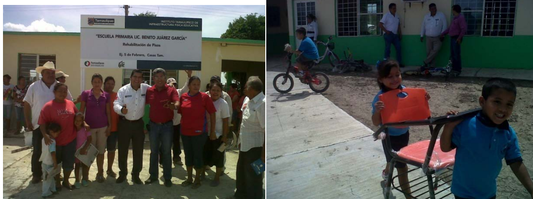
Entrega de mobiliario en Escuela Benito Juárez García del Ejido 5 de Febrero

El consejo Municipal de Participación Social en la Educación ha llevado a cabo acciones encaminadas a atender las solicitudes presentadas por los padres de familia y maestros en torno al mejoramiento de la infraestructura escolar, como ejemplo podemos señalar las mejoras realizadas en la Escuela Primaria Lauro Aguirre.