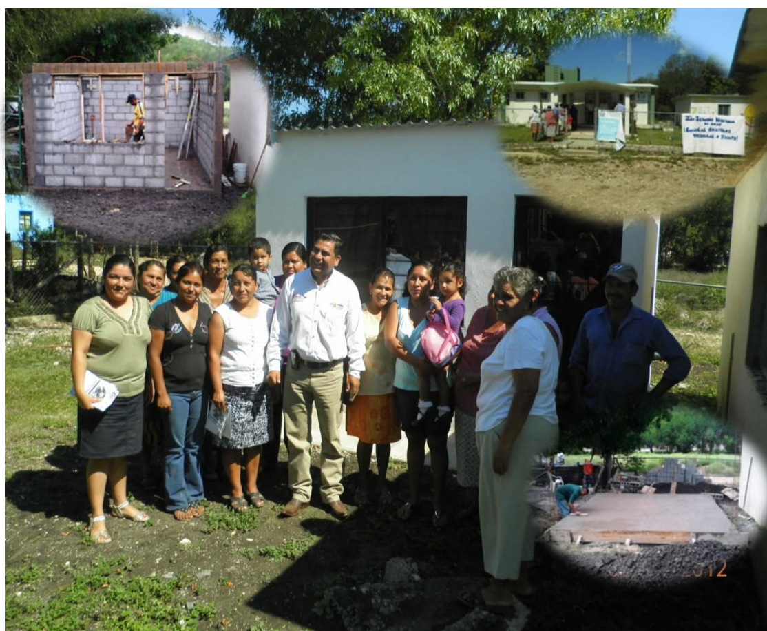
Centro de Salud en el Ejido San Antonio.

Con una inversión de 549 mil 443 pesos de Fondo de Infraestructura Social Municipal, FISMUN se ejecutaron obras de agua potable en los sistemas de Congregación La Pasadita, Congregación La Guadalupeana – Ejido Subida de Palmas, Ejido 5 de Febrero – Ejido 19 de Abril y Villa de Casas , abatiendo el rezago de agua potable en el que se encontraban las dichas comunidades.