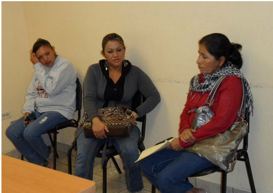
Ciudadanía en audiencia.

De enero a noviembre atendimos a mil, 105 ciudadanos en la gestión y solución a las problemáticas de los casenses.