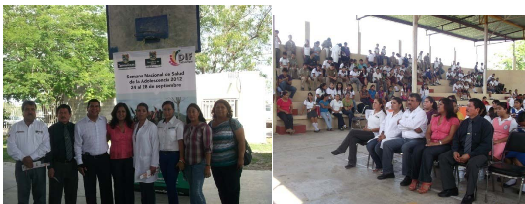
Clausura de la semana nacional de la Salud de la Adolescencia.

En el mes de octubre, en colaboración con la Secretaria de Salud de Tamaulipas y el DIF municipal el municipio fue sede de la clausura de la semana nacional del adolescente, en la Escuela Secundaria Romualdo Villarreal González, con la participación de alumnos del nivel secundaria y medio superior, quienes tuvieron una importante participación con actividades deportivas y artísticas, así mismo, la Secretaria de Salud proporcionó información de los diferentes programas que se manejan en prevención con la finalidad de concientizar y prevenir a los adolescentes, principalmente en torno a VIH y las adicciones.