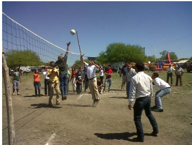
Participación en la celebración del día de la familia.

De igual forma, hemos continuado con los entrenamientos de tae kwon do, favoreciendo principalmente a la juventud casense.