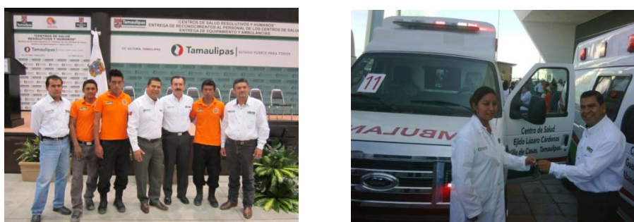
Centros de Salud resolutivos y humanos.