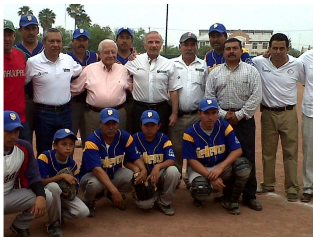
Liga de beisbol del municipio.