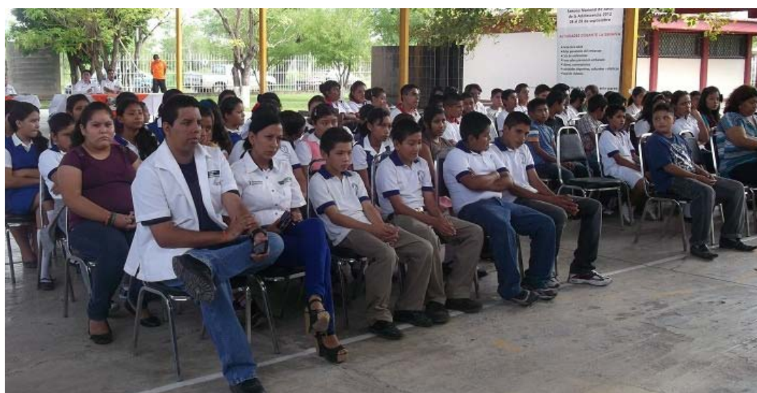
Clausura de la Semana Nacional de la Salud de los Adolescentes.