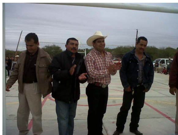
Inauguración de la Cancha en el Ejido Praxedis Balboa.

Dentro de las actividades del fomento deportivo, en enero de 2012, inauguramos la cancha de usos múltiples en el Ejido Praxedis Balboa , en la cual sus habitantes van a poder practicar diversos deportes como: basquetbol, voleibol, fútbol de salón, e incluso. Estas instalaciones podrán utilizarse para eventos cívicos y comunitarios.