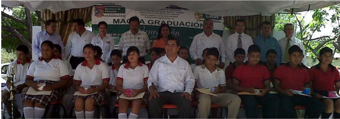
Magna graduación de las escuelas Telesecundarias Ejido Lázaro Cárdenas

Con recursos propios, en la ceremonia de fin de cursos del ciclo escolar 2011-2012 de los diferentes planteles educativos de los niveles preescolar, primaria, secundaria y medio superior se apoyo con lo necesario por un monto superior a los setenta mil pesos.