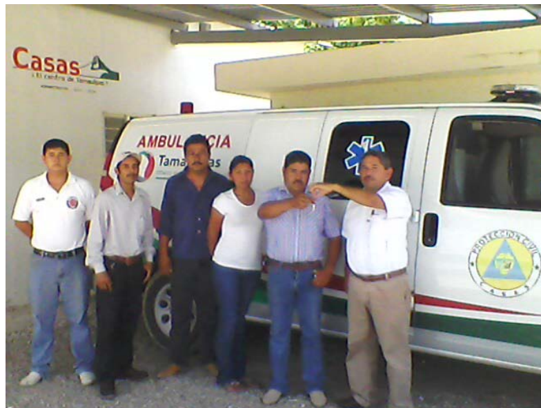
Entregando ambulancia en la Delegación Lázaro Cárdenas.

Con la finalidad de que en el municipio contemos con atención oportuna en el caso de emergencias, hemos hecho un esfuerzo financiero adicional, para remunerar con recursos propios a los voluntarios de Protección Civil y que estén en condiciones de proporcionar los servicios de urgencia que se presentan.