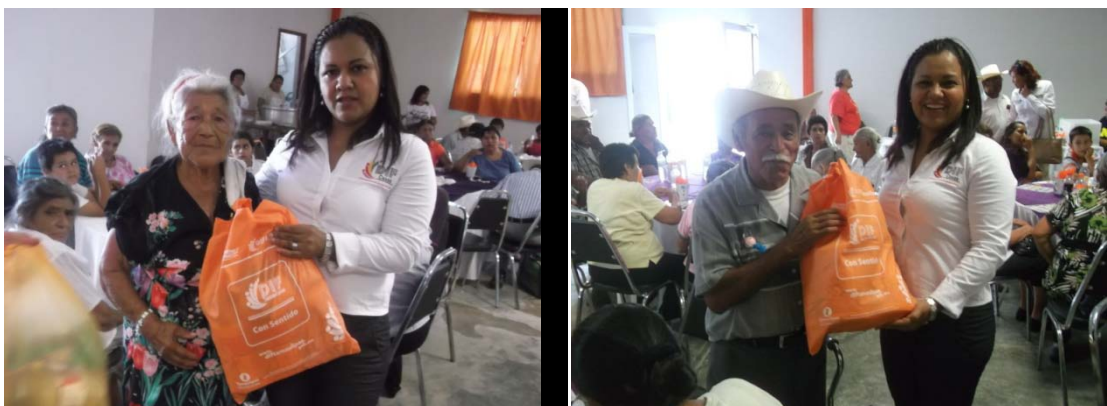
Festejo del Adulto Mayor.