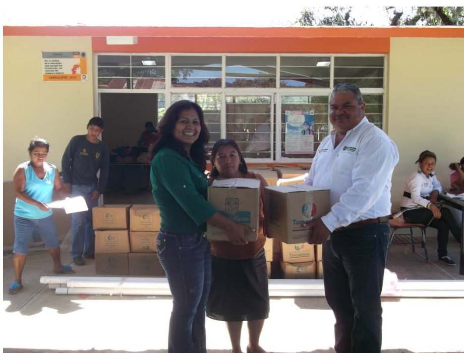
Entrega de despensas del Programa Nutriendo Tamaulipas en el Ejido Eduardo Benavides.

En este año gracias al apoyo del Gobernador Ingeniero Egidio Torre Cantú y la Señora María del Pilar González de Torres , presidenta del Sistema DIF estatal a través de SEDESOL y con el apoyo del Sistema DIF municipal, los habitantes de nuestro municipio se vieron beneficiados con el programa Nutriendo Tamaulipas en sus diversas modalidades y que atiende a mil 450 familias que representan el 100 por ciento de las familias vulnerables, es decir, en el 2012 entregamos 6 mil 49 despensas para todos los segmentos de la población.