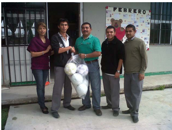
Entrega de material deportivo.

Dentro de las actividades deportivas del mes de febrero, se jugó la final Campeón de Campeones , en la cual entregamos un trofeo de campeón de liga y de campeón de campeones al equipo ganador, se les favoreció con la entrega de balones, también un estímulo económico al campeón.