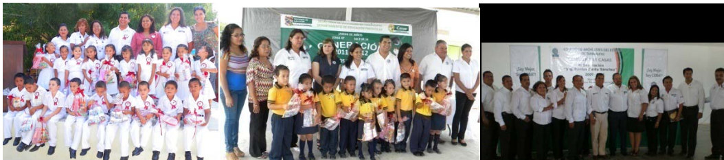
Ceremonia de graduación en diferentes instituciones educativas.